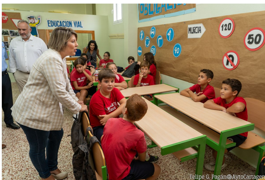
Felipe G. Pagán © AytoCartagena

sin tarjetas, se les recuerda en qué consiste la segunda oportunidad que se les ofrece, para poder obtenerlo (explicado en párrafos anteriores). Y también se contestan todas aquellas preguntas y dudas que puedan tener sobre el uso del carné. Y para finalizar, se hace entrega al tutor/a, de un sobre con todos los carnés de socio del PEV de sus alumnos, y de brazaletes reflectantes para cada uno de los alumnos asistentes y para los maestros que han venido con ellos. A cada una de las unidades de 5º de Primaria se le dedica una jornada matinal, de aproximadamente 4 horas., incluyendo en este tiempo, la preparación de las charlas y el mantenimiento de los vehículos a utilizar.